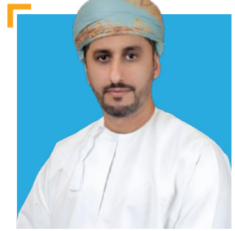
سعادة الشيخ محمد بن سليمان الكندي محافظ شمال الباطنة، رئيس مجلس إدارة جسور