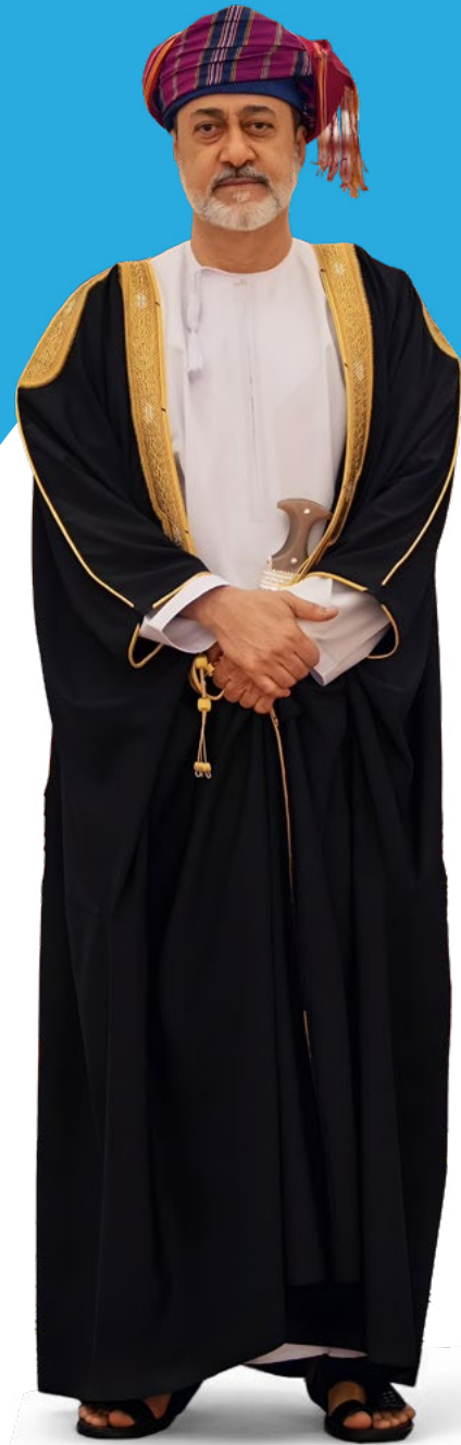
His Majesty Sultan Haitham bin Tariq