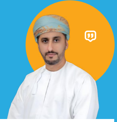
سعادة الشيخ محمد بن سليمان الكندي

واصلنا في مؤسسة جسور تنفيذ مشاريعنا الاجتماعية وفقاً لأعلى معايير الجودة والكفاءة، معتمدين في ذلك على منهجيات علمية تضمن تحقيق الأثر الإيجابي المنشود، وشملت هذه المشاريع مجالات متنوعة، كالتعليم والتدريب، وريادة الأعمال، إلى جانب المبادرات البيئية والصحية التي تساهم في تحسين جودة الحياة في محافظة شمال الباطنة.