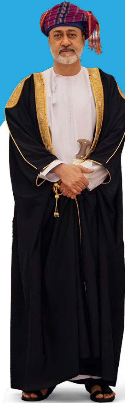
حضرة صاحب الجلالة السلطان هيثم بن طارق - حفظه الله ورعاه -